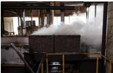
4. Dalla fusione della suberina presente nel sughero, che agisce come unico collante naturale, nasce il pannello CORKPAN con il suo caratteristico colore bruno.