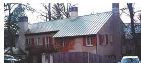
IMMAGINI A LATO - Le fotografie a lato si riferiscono ad un cappotto realizzato nel 1927 a Chesnut Hill (USA), ancora efficiente e fotografato nel 2012.