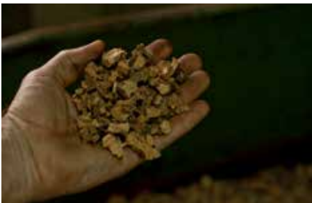
1. La separazione delle impurità e delle parti legnose avviene attraverso setacci in serie. Segue la riduzione a granulo.