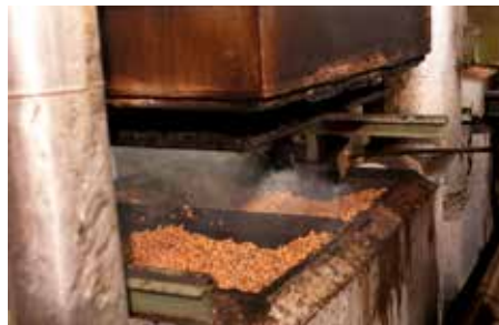
2. L'espansione e la fusione delle sostanze cerose avvengono in stampi metallici, grazie a vapore a 380°C.