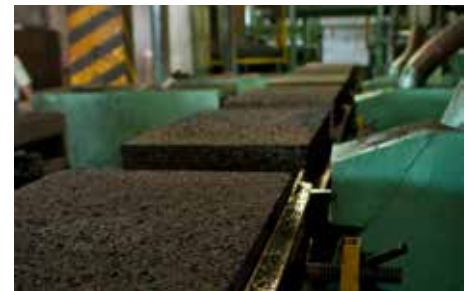
6. La squadratura del blocco, il taglio, la calibratura e la depolverazione, permettono di ottenere pannelli squadrati e planari, così da facilitarne la posa.