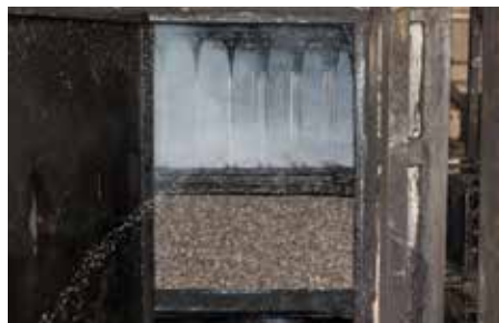
5. Il raffreddamento dei blocchi tramite aghi che iniettano acqua a circa 80°C permette di controllare il processo termico, evitando il rischio di combustione.