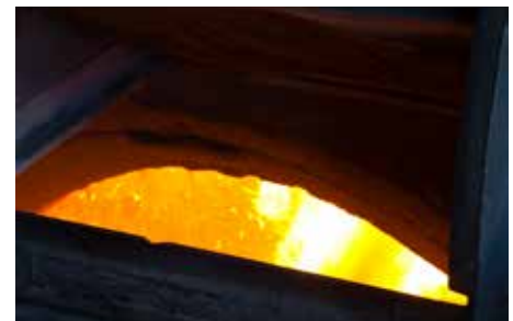
3. Oltre il 90% dell'energia necessaria per la produzione deriva dalla combustione di biomassa (scarti e polveri).