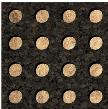
Mod.: ROUND | Tipo: NATURA