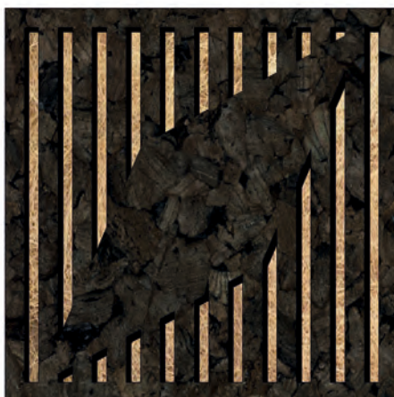
Mod.: DIAMOND | Tipo: NATURA