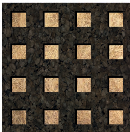
Mod.: SQUARE | Tipo: NATURA